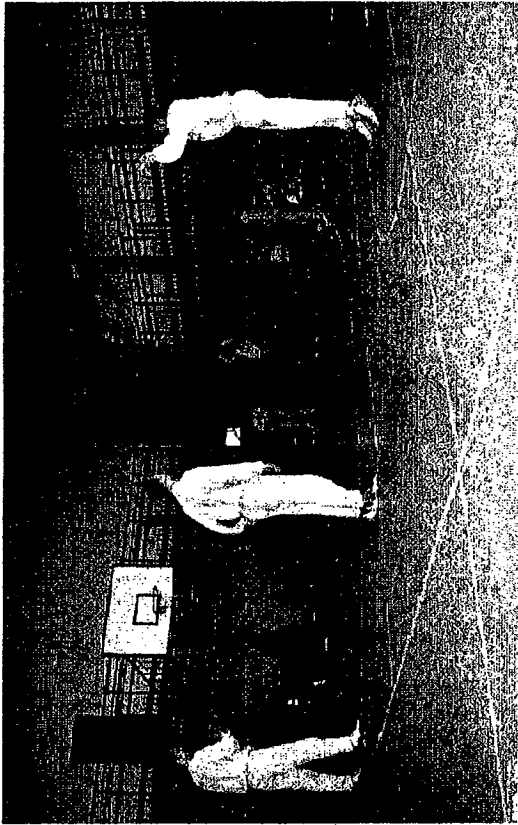
Federico Antinori prima tira da metà campo (facendo canestro)...