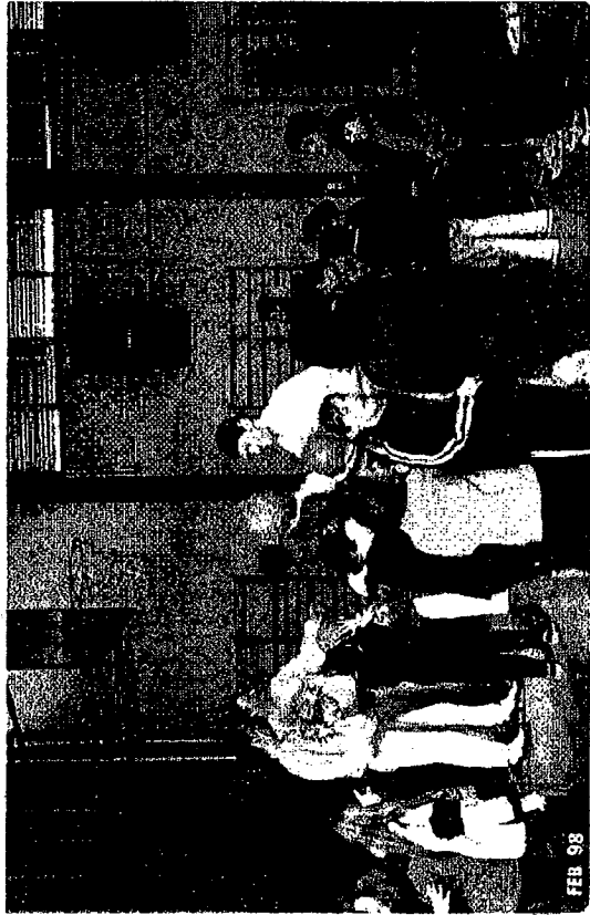
....poi impartisce lezioni di basket ai bambini.